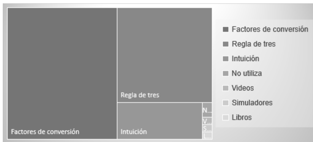
Fig. 1: Métodos usados para resolver problemas

En la figura 1, se presenta el análisis de las narrativas y la proporción que genera N-Vivo al contabilizar la frecuencia de las categorías base para resolver problemas, la mayor frecuencia 206 se obtuvo para factores de conversión, seguido por regla de tres (128), intuición (45). Como categorías emergentes se descifrarón: no utiliza, con una frecuencia de 2 y uso de videos de YouTube a manera de tutoriales, simuladores en línea, consulta de libros con frecuencia igual a 1.