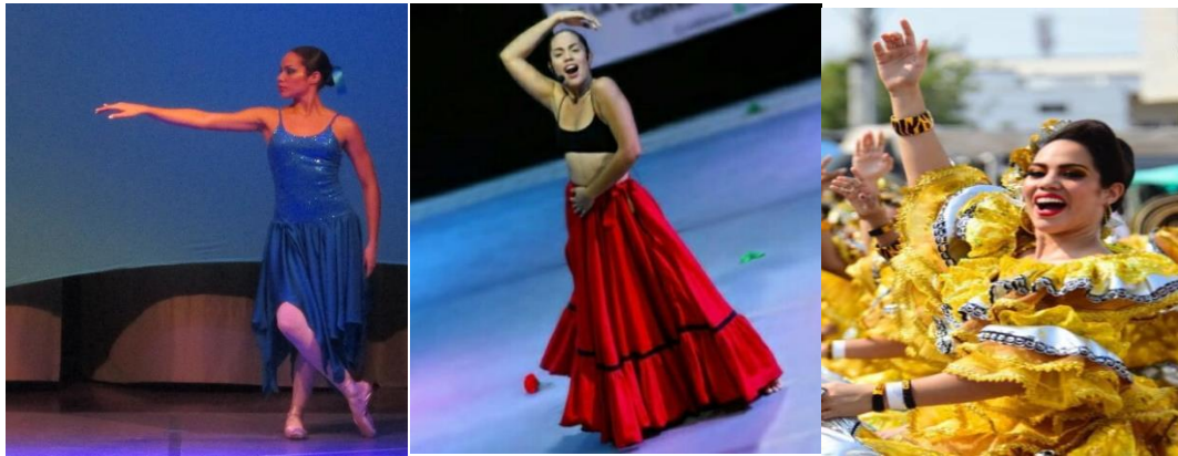
Procesos participativos y creativos.