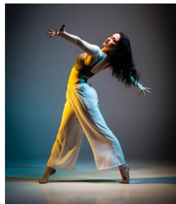
Danza como expresión.