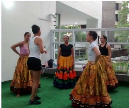
Ensayo “Mujeres doradas”, 1er acto