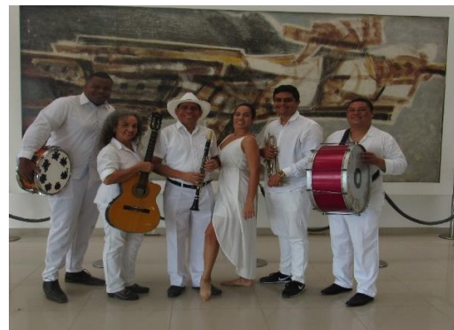
Sustentación escénica de anteproyecto