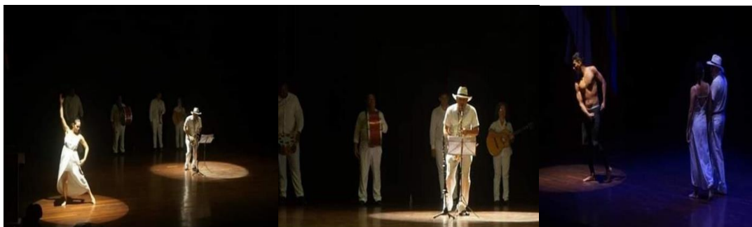
Sustentación escénica de anteproyecto (VII Semestre)