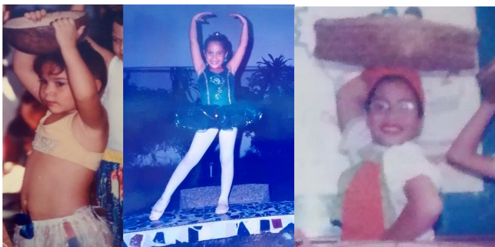
Contacto con distintas manifestaciones artísticas en mi infancia.