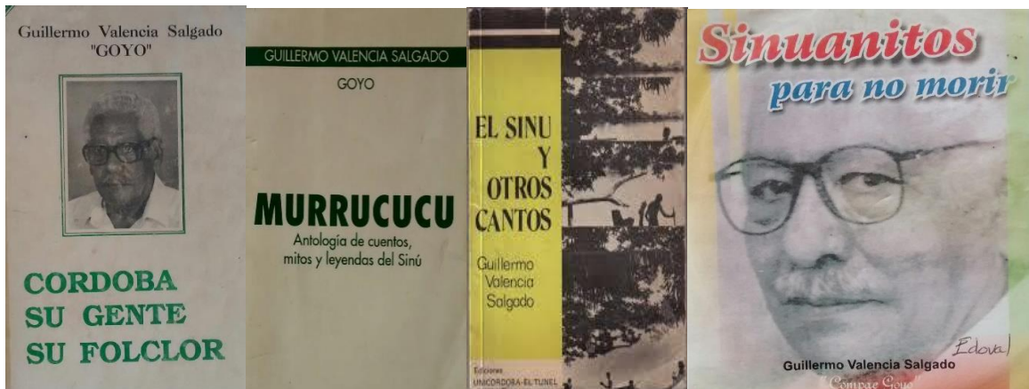
Obra de Guillermo Valencia Salgado.