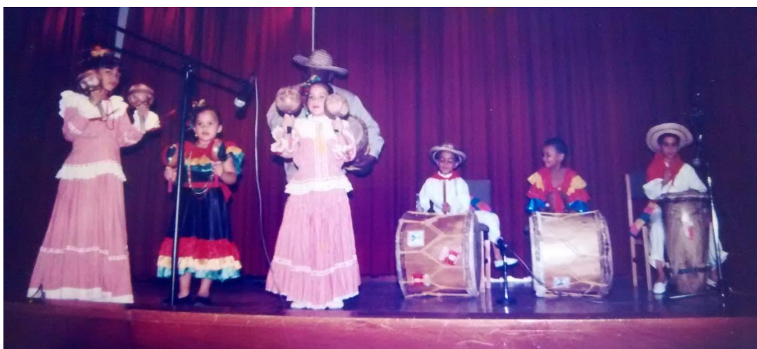
Contacto con la tradición en el grupo folclórico” Los primos”