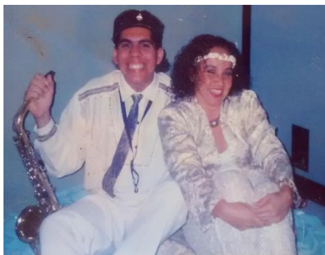
Mis padres antes de mi nacimiento.