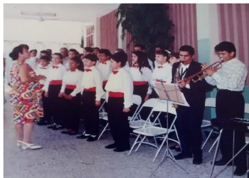
Mi madre durante mi embarazo