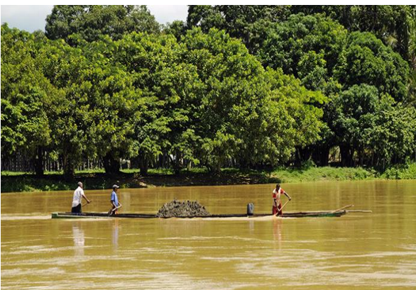
Río Sinú, fuente vital de la sinuanología.