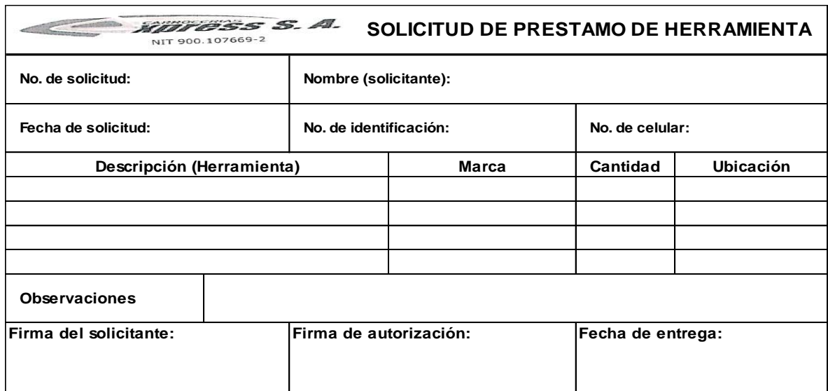
Cuadro 1. Solicitud de préstamo de herramienta.

Posteriormente se elaboró a petición de la gerente general, un formato de solicitud para los casos donde se realizará el préstamo de alguna de las herramientas con las que cuenta la empresa, teniendo en cuenta la información de la herramienta y del solicitante, así como las fechas de solicitud y de entrega de la herramienta, en concordancia a dicha petición, se creó el siguiente formato: