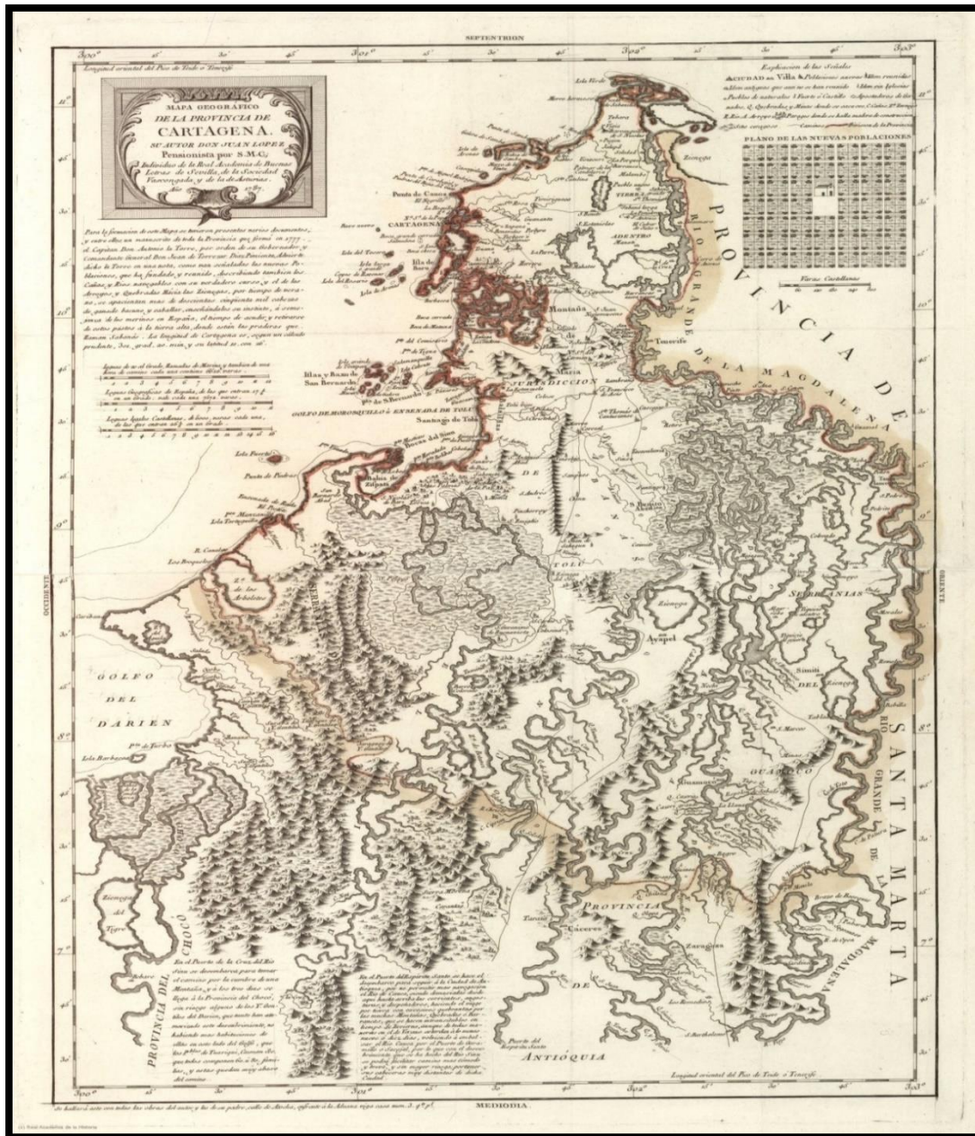
Mapa Geográfico de la Provincia de Cartagena de 1787. 21