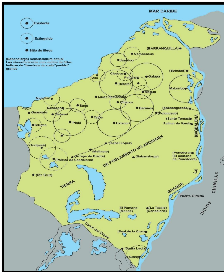
Poblamiento del partido de Tierradentro, siglos XV-XVI 28 .