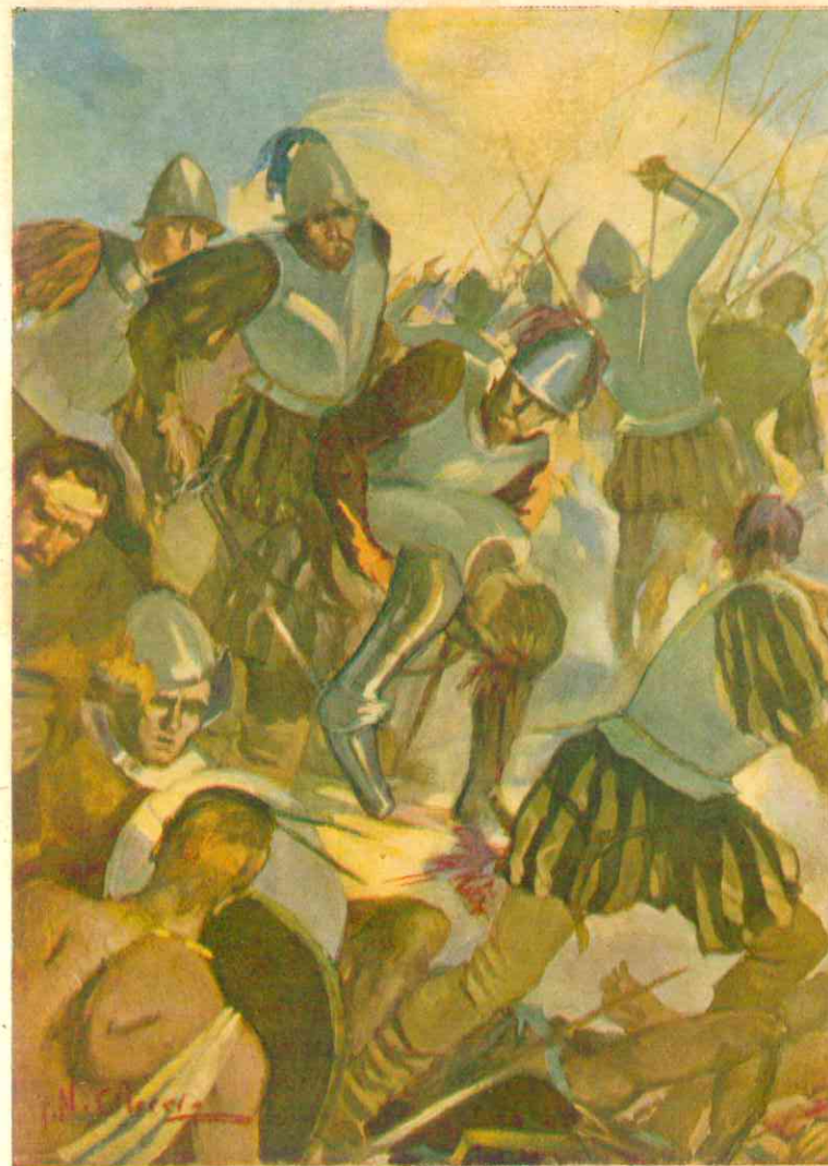
... cayó sobre su cabeza una piedra enorme ...

Dueños de la fortaleza los españoles, Hernando dejó en ella una guarnición y volvió a la ciudad, donde le esperaba la pena