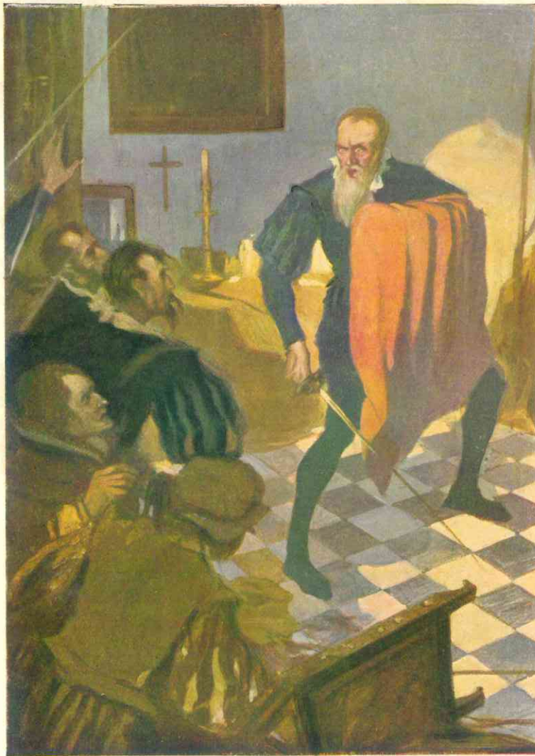
— ¡Atrás, traidores! — gritó a los asesinos. — ¿Por qué queréis matarme?

Entonces salieron, para cubrir la puerta con sus cuerpos, mientras Pizarro acababa de abrocharse la armadura, Martínez de Alcántara, Gómez de Luna y los dos pajes, quienes resistieron al choque y se defendieron como leones. La lucha fué desigual y terrible: Martínez de Alcántara, haciendo honor a su sangre, resistió como un héroe, logrando matar a dos de sus enemigos. Pero también él recibió tremendas heridas, como su compañero Gómez de Luna, y comenzaron a flaquear sus fuerzas. Al verle caer, debilitado por la pérdida de sangre, Pizarro arrojó lejos de