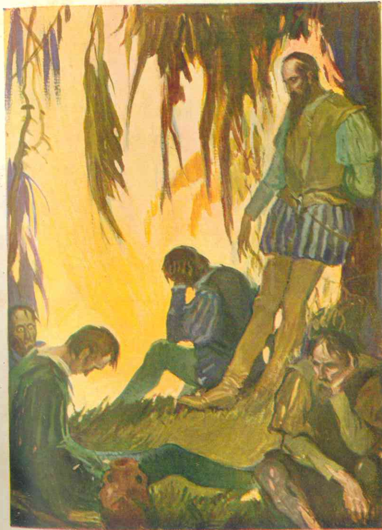
... veía a sus hombres doblarse al peso del dolor y caer extenuados ...

Cincuenta fueron los exploradores que con su capitán se quedaron en aquel puerto que llamaron del Hambre. Todos eran bravos, pero habrían preferido vivir en continua batalla contra un enemigo superior en número y armamento, a verse perdidos en aquella ciénaga y obligados a esperar la muerte mano sobre mano, sin poder intentar nada en su defensa. Vivían entre el fango y casi sin esperanza. Por un lado les cerraba el paso