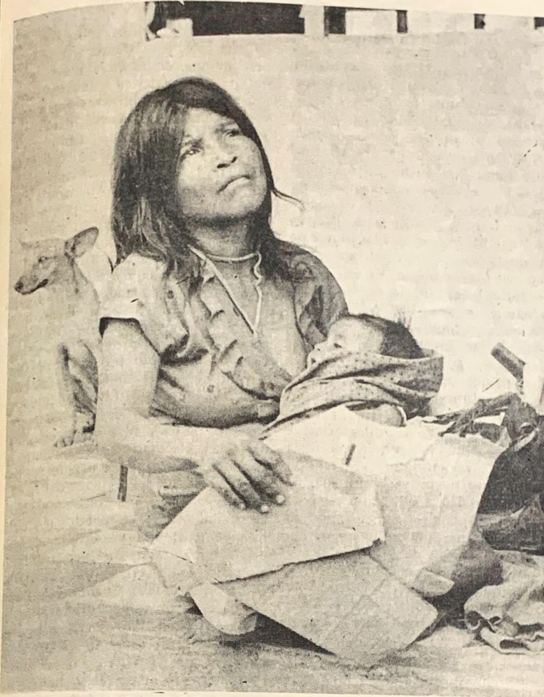
Mujer Indígena de la Serranía de Perijá.