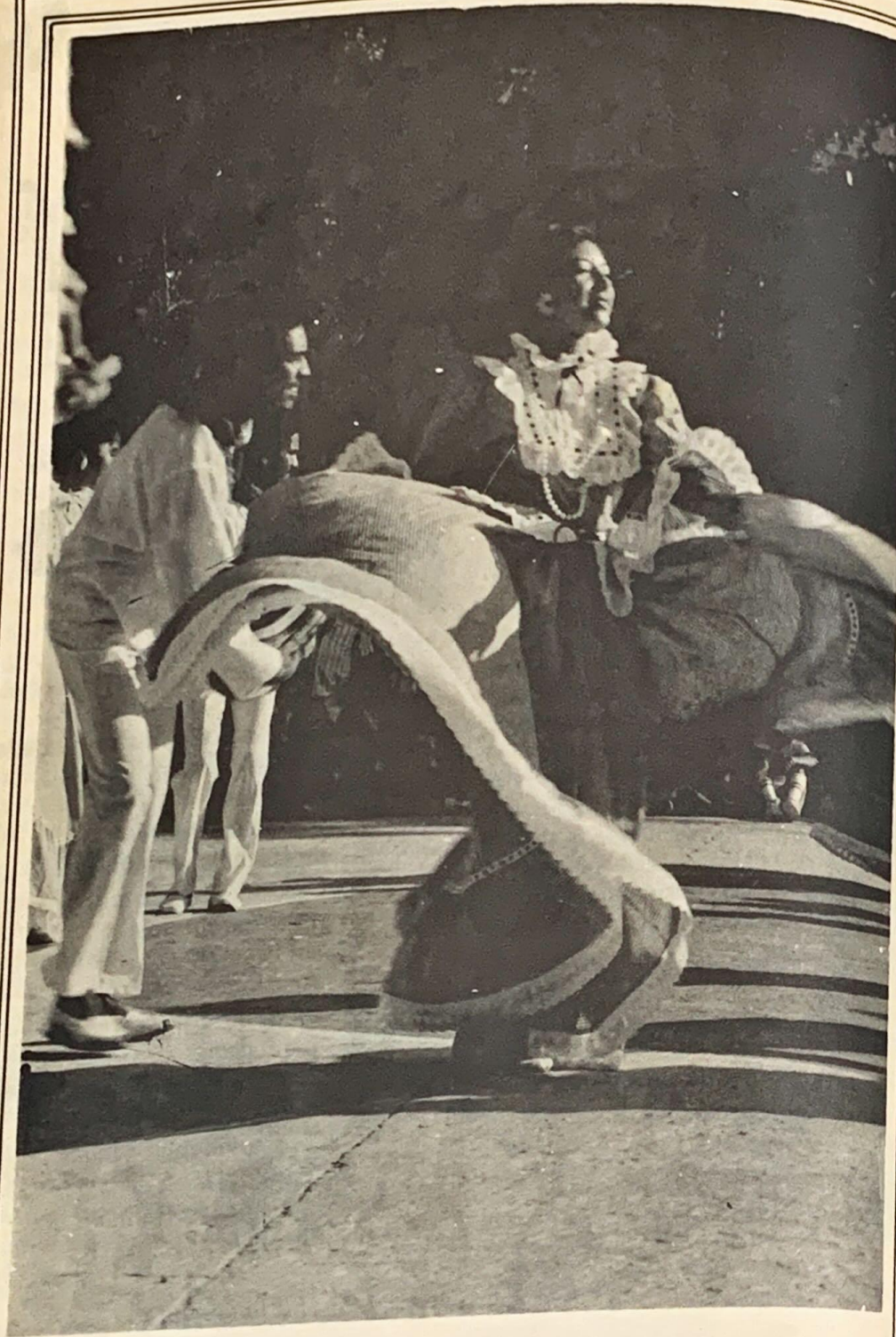
Pareja bailando Cumbia La mujer también es perpetuadora de nuestras tradiciones Culturales.