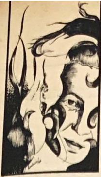
Portada Leonor Palacio