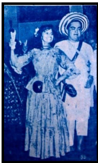
El carnaval de Barranquilla como expresión popular en espacios de elite 13