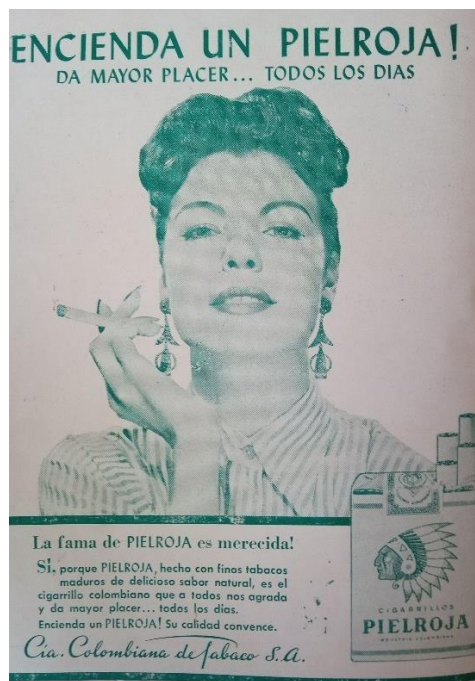
Relación entre varios tipos de placer en la publicidad de Piel Roja 77

Tal es el caso del uso de la imagen femenina presente en la publicidad, que al utilizarla como un aditamento dentro de la simbología que representa el total de la imagen, enmarcándola en una idea global de aceptación, lo que es común en la publicidad de los cigarrillos “Piel Roja”, en donde se ve a una mujer que sostiene un cigarrillo estableciendo la relación entre los dos objetos dentro de la composición, lo cual es acompañado por una