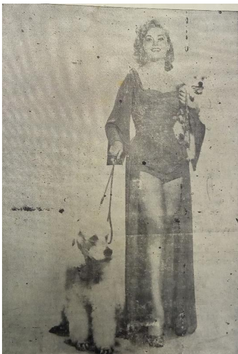
Foto de bañista europea, nótese el uso del perro como elemento de distinción 54

Es interesante ver como “Existían dos tipos de belleza diferentes que caracterizaban a la mujer de los años 50, una, la de aquellas damas que en su cara mostraba ingenuidad, quienes se caracterizaban por ser jóvenes y con estilo activo; por otro lado, estaban aquellas mujeres mucho más atractivas más irreverentes con el look de “Mujer fatal.” 55 Para el caso de la revista la parte “ingenua” es la que se intenta mantener en toda las publicaciones propias, casi como si se tratara de una marca, pero el lado “mujer fatal” se veía representado en la publicidad presente en la revista como el caso de los cigarrillos Piel Roja, naturalmente la intención de lo femenino en la publicidad era algo que no podía controlar la línea editorial de la revista.