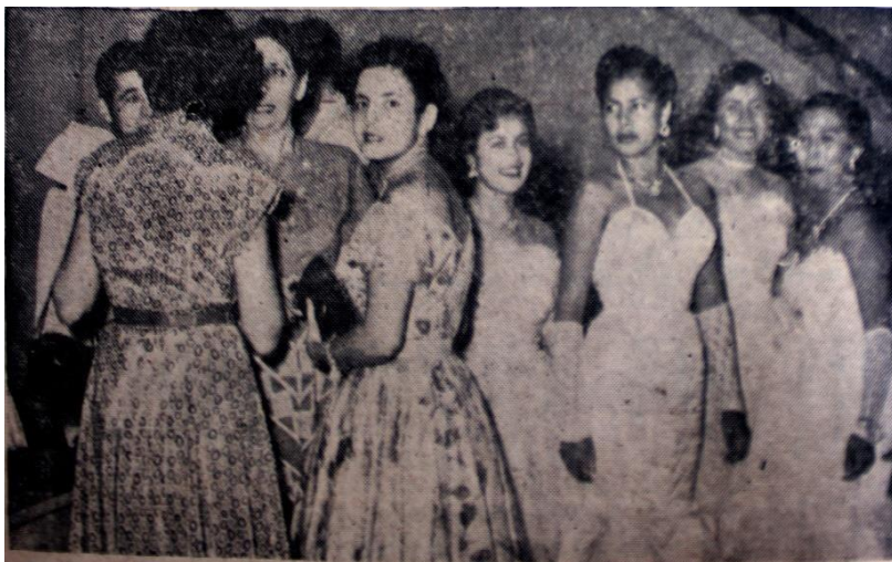
Contraste entre moda femenina tradicional-cotidiana (izquierda) vs una moda femenina de “mujer fatal”-modelos extranjeros (derecha) 83 .

Todos estos elementos también deben analizarse en su forma escrita pues el cómo se escribe sirve para entender cómo funciona la distinción mediante las palabras, teniendo en cuenta tanto lo que se dice y lo que no, así el cuerpo como proceso escritural es el resultado del ejercicio histórico de escribir, lo que determina las variables en función de ciertos procesos sociales, económicos o de otra esfera, que producen un dominio del objeto, dicho objeto es subordinado a lo escrito, de tal modo que al dominar una forma de escritura se logra inventar modos y configuraciones de la corporalidad 84 .