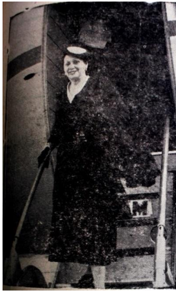
Podemos observar una vestimenta que está fuera de la idea tradicional del vestido. 42

También es notable la poetisa cucuteña María Ofelia Villamizar Buitrago, para este caso nos encontramos con que la revista y la intención de del Castillo era crear una especie de red cultural, no solo con información del extranjero, sino que mantenía abiertas las puertas a personas de otras partes del país dándole valor a las construcciones artística interregionales. Como resultado en su poema “Romance de la Reina Marinera” Villamizar habla sobre la reina del carnaval 1956, lo cual queda constatado en una carta que la poetisa dirigió a la revista, la cual en uno de sus apartes expresa que.