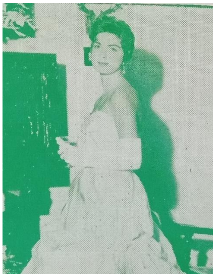
Candidata al reinado del Atlántico (1957) quien era apoyada abiertamente por la revista. 51

A lo que Lipovetsky se refiere como “narcicismo analítico” siendo “esencialmente a la fuerza preponderante del código de la belleza femenina: el valor otorgado a la belleza femenina da lugar a un inevitable proceso de comparación con las demás mujeres y a una observación escrupulosa del propio físico en función de unos cánones reconocidos, una evaluación sin concesiones referida a todas las partes del cuerpo.” 52 Debido a que “todas las regiones del cuerpo femenino son investigadas, el narcicismo analítico detalla el rostro y el cuerpo en elementos distintos, dotados uno por uno de un valor más o menos positivo: nariz, ojos, labios, piel, hombros, senos, caderas, nalgas, piernas son objeto de una autoapreciación y de una autovigilancia que conlleva unas «prácticas propias» específicas, destinadas a poner de relieve o corregir tal o cual parte del físico.” 53