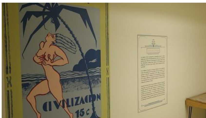
En “Motivo Tropical” es interesante observar cómo se representa la desnudez como un acto de libertad. 18