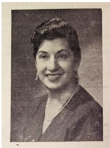
Directora copropietaria del instituto Técnico Comercial 33

En un sentido más profundo está relacionado con la especialización que en esta década tenían las mujeres de la clase alta 34 así en la sección “movimiento educacionista” 35 se enteraban que muchacha había cursado algún estudio, claro está, la sección no era de uso exclusivo de mujeres y pese a que se puede relacionar a primer vistazo con el movimiento estudiantil, la sección por sí misma solo tenía como objetivo mostrar los estudios y decisiones de formación que tenían las personas que allí aparecían, esto como un símbolo de estatus y de visibilidad frente a la comunidad a la cual pertenecían.