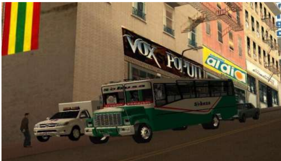
Figura 5. Captura de pantalla de algunos autos que se pueden incluir dentro del juego. (2014). Elaboración propia.

Anterior mente en mi obra GTA Barranquilla del 2014, donde también hacia animación dentro de GTA San Andreas, ocurrieron ciertas consecuencias a la hora de compartir en redes esta obra, en el video “El Gran Bastardo” el cual fue uno de tres videos de esa obra, utilice un modelo del bus de la empresa Sobusa de una forma que ellos como entidad lo tomaron ofensivo y que afectaba a su imagen pública.