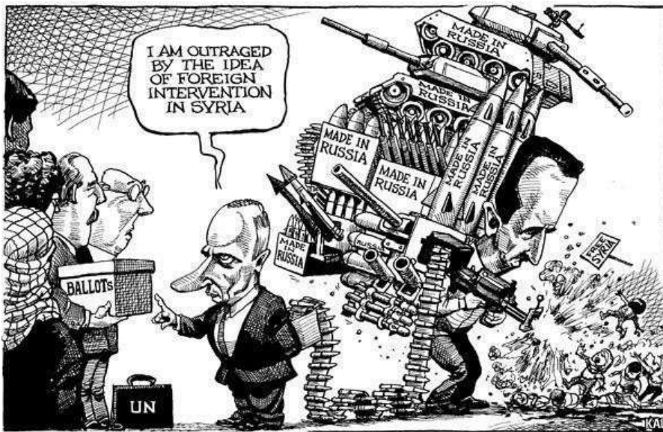
Figura 10. Caricatura que critica las intervenciones de Rusia en Siria. Kevin Kallauger. (2012).