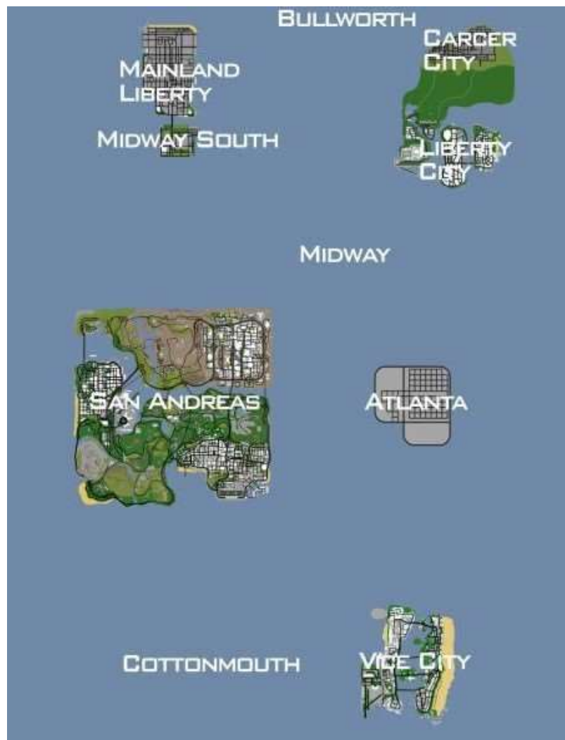
Figura 2. Asi se ve el mapa de GTA San Andreas luego de instalar el mod, se puede apreciar que están las demás ciudades de otros juegos. GTA: Underground Development Team (2015).

Mod Gta Underground: es un mod súper ambicioso que aun esta en desarrollo, el cual pretende unir otras ciudades de la saga de videojuego GTA en el mismo mapa de San Andreas, esto a nivel técnico es muy grande porque implica añadir todo el modelado 3D de otros videojuegos para incluirlo en uno solo, ya llevan varios años desde que salieron las primeras versiones, pero aún no está terminado.