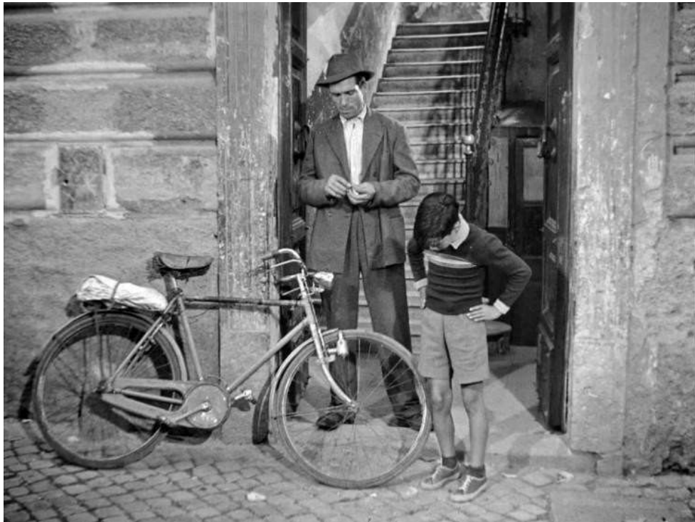
Figura 6. Escena de la película donde minutos después al protagonista en pantalla le roban su bicicleta.