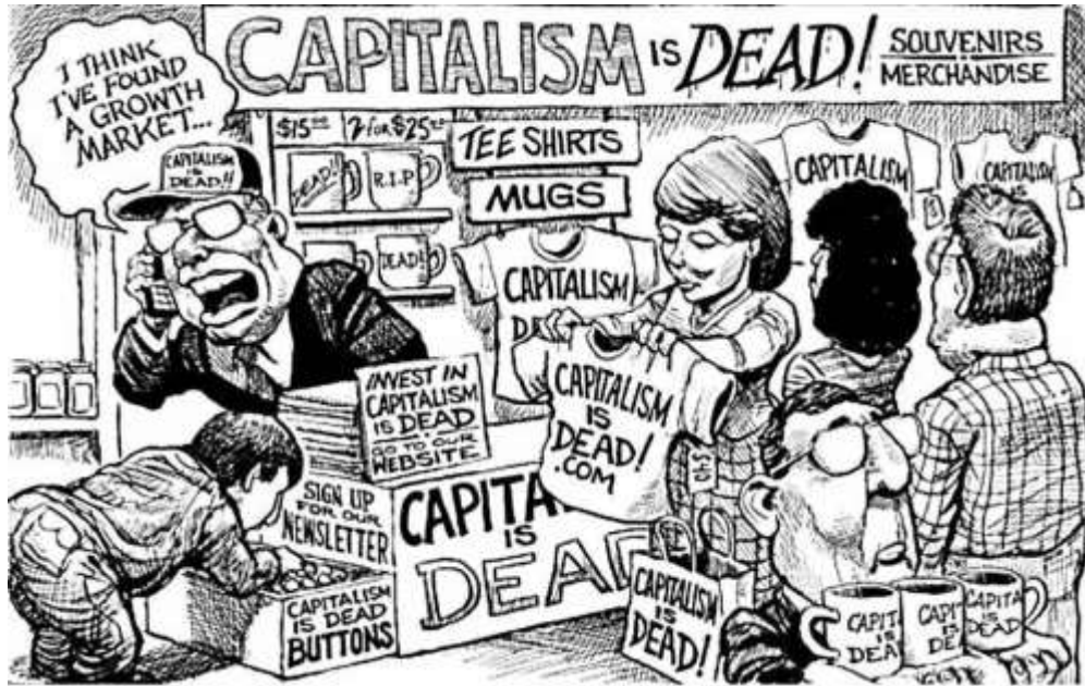
Figura 9. Caricatura que habla sobre ironías del capitalismo. Kevin Kallauger. (2008).