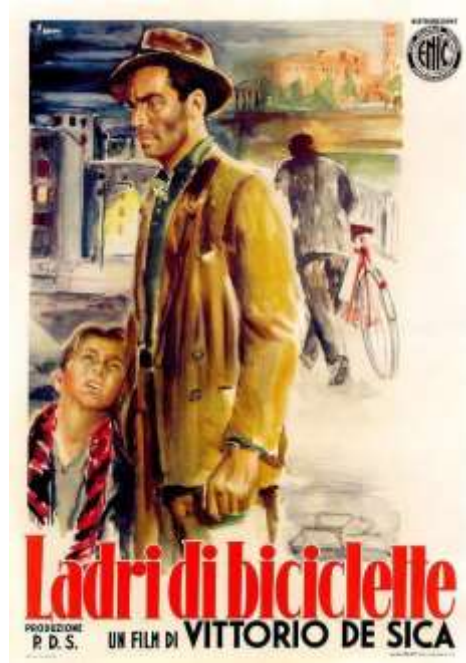
Figura 5. Poster promocional de la película “El Ladrón de Bicicletas”. Vittorio de Sica. (1948).