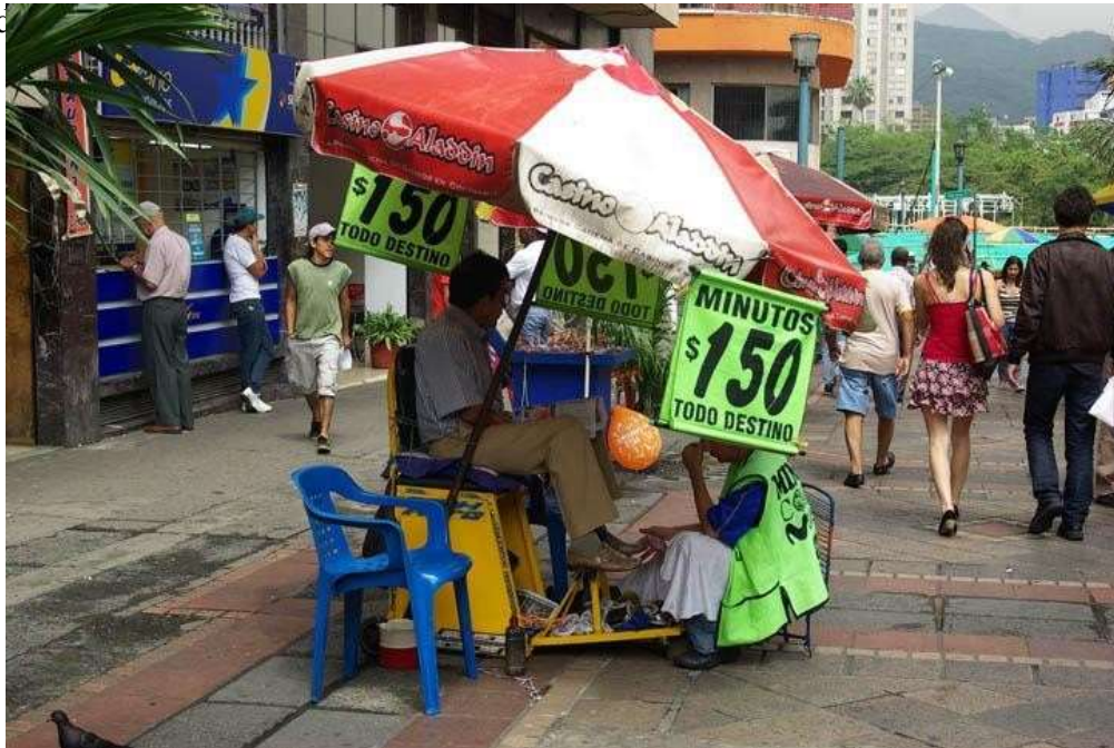
Figura 8. Puesto típico de venta de minutos que se pueden encontrar en todo el país colombiano. Andrés

Además, estarán presente dentro de los escenarios del corto, aspectos visuales y sonoros como son frases y letreros comunes que uno puede encontrarse en diversas partes, la mayoría surgidos de negocios característicos de nuestra región y que también se ven varias partes del país, tales como el letrero de minutos que uno se encuentra en un Sai de esquina (puesto de venta de minutos), o el clásico lema de las hamburguesas que venden en vehículos en algunos puntos “¿A cómo? A $2.000”, “se alquilan Lavadoras”, el tipo que vende aguacates por la calle, los que venden bollos, limpiadores de vidrios y malabaristas de semáforo, domiciliarios de tienda y restaurantes, otros letreros genéricos de ventas de comidas rápidas, todos estos marcados con tipografías reales intentando llevar la estética real hasta donde