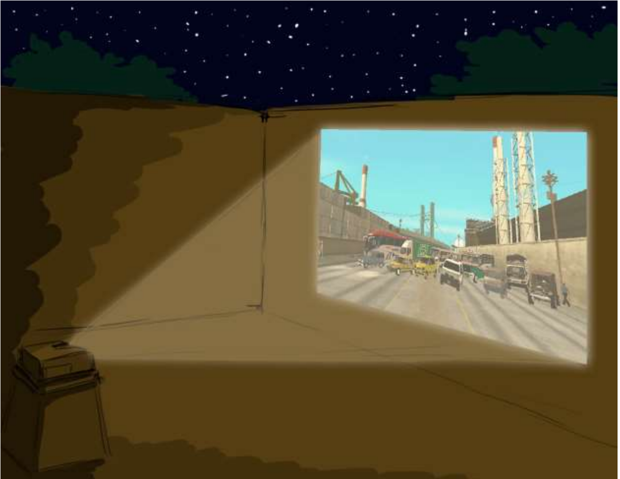
Figura 6. Posible visualizaicion. (2018). Elaboración propia.

Proyección con video beam sobre pared en patio, o zona abierta preferiblemente para una mayor capacidad de espectadores.