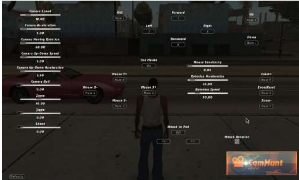
Figura 3. Menú de configuración del mod Camhunt. BoPoH (2013)

Camhunt: este es un mod muy buena para hacer grabaciones, te permite controlar libremente la cámara del videojuego, con efectos de movimientos y demás cosas los cuales te permiten hacer tomas excelentes.