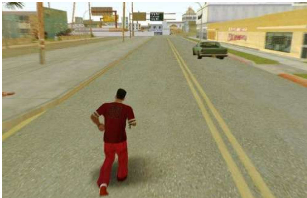
Figura 4. Ejemplo de ángulos que puedo lograr con este mod en mi GTA. (2018) Elaboración propia.